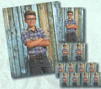
Secondary Look La Segunda Estilo