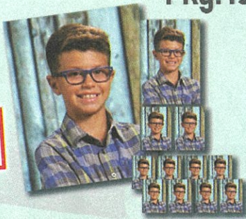
Primary Look El Primer Estilo